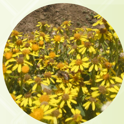
SEGUNDA FLORACION DE LA QARIWA QARIWANA TAYPI THUTHUMPI