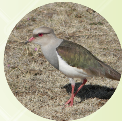
UBICACIÓN DEL HUEVO DEL LIQI LIQI. LIQI LIQINA K'AWNA UCHATAPA.