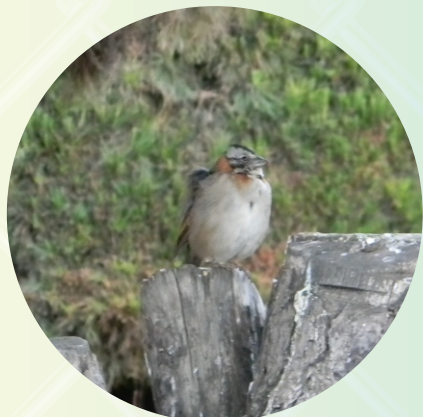
TRINAR DEL GORRION ANDINO. P'ISQILLAWCHINA ART'APA