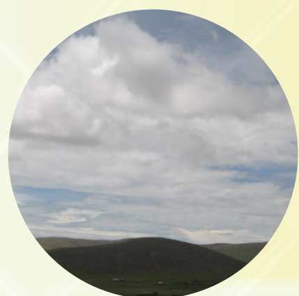
LA FORMA Y COLOR DE LAS NUBES.