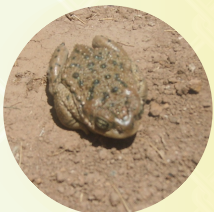
EL COLOR DE LA PIEL DEL SAPO JAMP'ATUNA JAÑCHI SAMIPATA