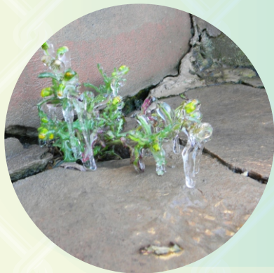
DIA 6 HELADAS SUXTA URUNA JUYPHINAKA