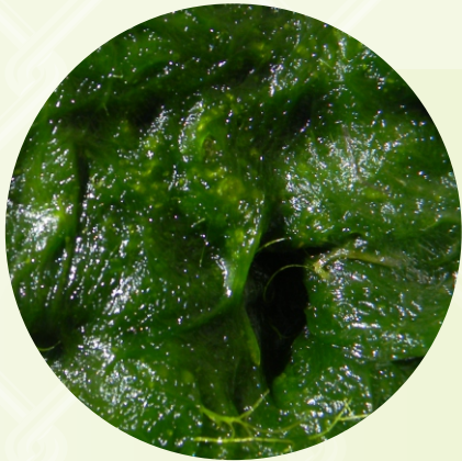
EL COLOR DE LA ALGA LAQHUNA SAMIPA