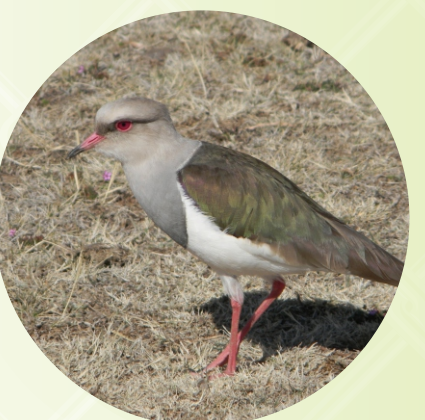
UBICACIÓN DEL HUEVO DEL LEQUE LEQUE. LIQI LIQINA K'AWNA UCHATATA.