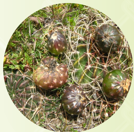
EL FRUTO DEL SANK'AYU SANK'AYUNA ACHUPA