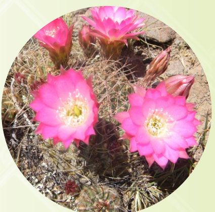
TERCERA FLORACIÓN DEL SANK'AYU SANK'AYUNA QHIPA PANQARATA.