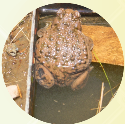
EL COLOR DE LA PIEL DEL SAPO JAMP'ATUNA JAÑCHI SAMIPATA