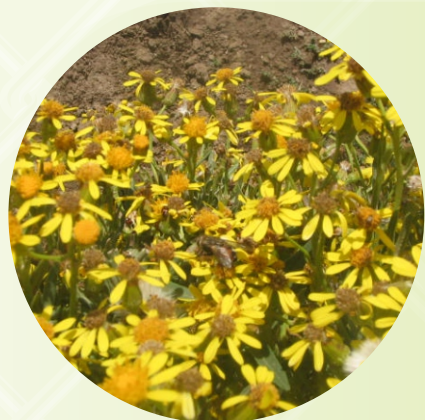
TERCERA FLORACIÓN DE LA QARIWA QARIWANA QHIPA PANQARATA