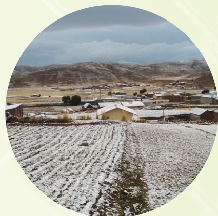
LAS NEVADAS KHUNUNTAWI