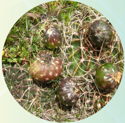
FRUTO DEL SANK'AYU SANK'AYUNA ACHUPA