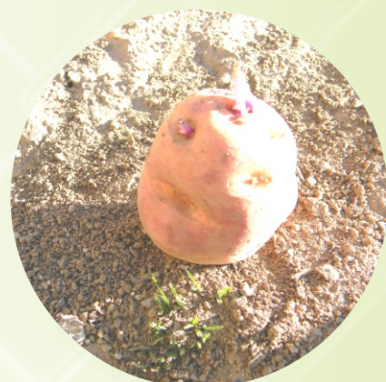
BROTE DE PAPA CH'UQI ALIQATA.