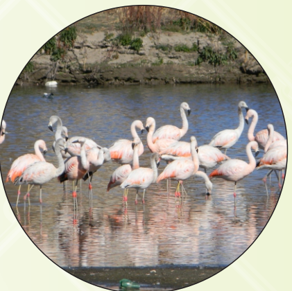
PRESENCIA DE PARIHUANAS. PARINANAKANA PURINIPA